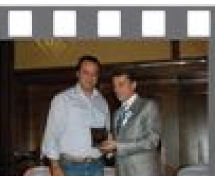
Sr. Cengiz Bayar Barbaros Petrol