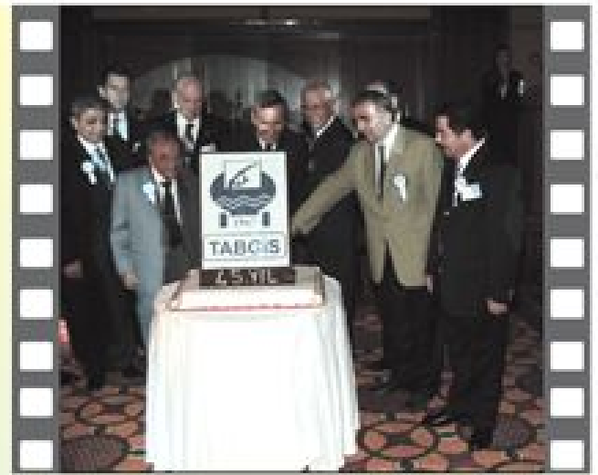
EPDK Başkanı Sn. Hasan Köktaş, EPDK Kurul Üyesi Sn. Celal Ustaoglu, TABGIS Yönetim Kurulu ve Kurucu Üyelerden Sn. Turgut Saydam 45. Yıl Pastasını Keserken

Gün gelmiş Akaryakıt sayısında makaralı pompalar 40-50 centlere bol bulamaç Akaryakıt satmış gün gelmiş, Akaryakıtta karne