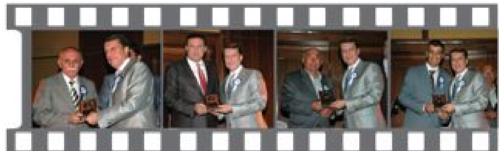
Sr. Tarun Özkan Ate Kolektif Şirketi

Cesaretle ÖTV indirimi yapılması halinde ülkede maliye hazinesinin bir kuruluş ÖTV kaybına uğramadan bu sektörün bu sorununu aşabileceğini ifade eden Ketenci, "Sorun budur, buradadır. Yoksa 776.000 km'lik bir alanda 10.000 km'lik bir kara ve deniz hududunda polise tedbirler ve ulusal marketle cebelleşmek değildir." Şeklindeki görüşlerini belirtti.