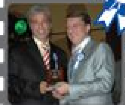
Sr. Yaman Batu Batu Petrol