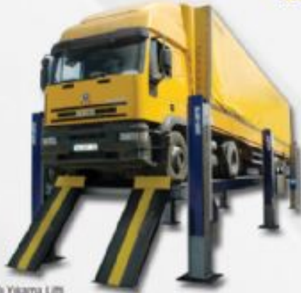
Yüksek Tonajlı Yıkama Lifti