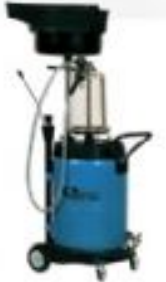
Karterden Yağ Emme