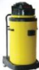
Islak Kuru Elektrik Süpürgesi