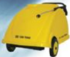
Sıcak Soğuk Yıkama Makinası