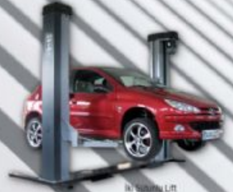
İki Sütünlü Lift