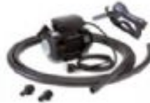
Ad/Blue Transfer Pompası