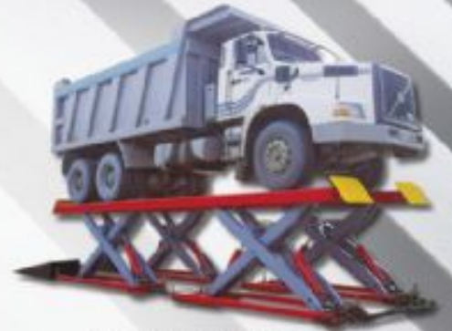
Yüksek Tonajlı Tamir Bakım Lifti