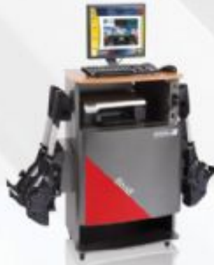
Rot Ayar Cihazı