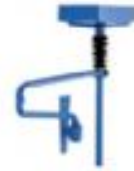
Kirli Yağ Toplama Aparatı