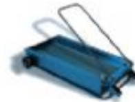
Kirli Yağ Toplama Arabası