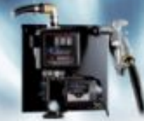
Mazot Transfer Pompası