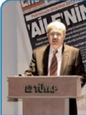
Mahmut Mücahit Fındıklı TBMM Enerji Komisyonu Başkanı