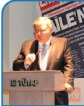
Yağcı Eyüboğlu TOBB Türkiye LPG Meclisi Başkanı