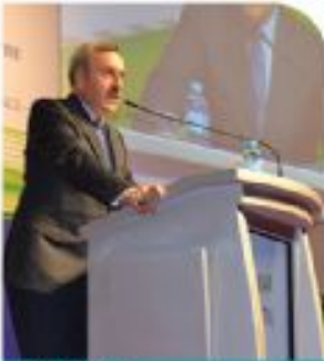
Hasan Köktaş EPDK Başkanı

Türkiye'deki toplam kömür rezervi işletildiği takdirde bunun Çin'in 3-4 yıllık üretimine denk geldiğini anlatan Yıldız, "Artık enerji sektöründe çizilen politikalar ve stratejiler devlet politikası haline gelmiş, yerli kaynakları artırmaya çalışan bir yapı içerisinde" dedi.