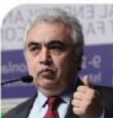
Fatih Birol Uluslararası Enerji Ajansı Baş Ekonomisti

Uluslararası Enerji Ajansı Baş Ekonomisti Fatih Birol, Türk yatırımcıların enerji zengini çevre ülkelerde petrol, gaz ve elektrik alanında yatırım yapması gerektiğini söyledi. Türkiye'nin önümüzdeki 5 yıl içindeki enerji politikalarının çok kritik olduğunu belirten Fatih Birol, "Türkiye'nin çevresindeki ülkelerde hem petrol hem de doğalgaz açısından önemli potansiyeller doğuyor. Türkiye dünyadaki rezervlerin yüzde 70'ine komşu. Türk yatırımcılar bu ülkelerde doğalgaz, petrol ve elektrik alanında yatırım yapması gerekiyor." dedi.