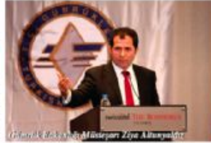
Gümrük Bakanlığı Müsteşarı Ziya Altunyalız

ve en fazla ithal edilen ürünlerden biri olması dolayısıyla maliyeti yüksek olan motorinin tüketiminin azaltılması gerektiğini söyleyen Ferruh Temel Zülfiyar, akaryakıt ürünlerinin birbirleri arasında vergi dengelemesi yapılması suretiyle hem ürün fiyatlarının düşürülmesi hem de devletin vergi gelirinde azalmaya sebep olmadan kaçakçılığın ve cari açığın önüne geçilebileceğini vurguladı.